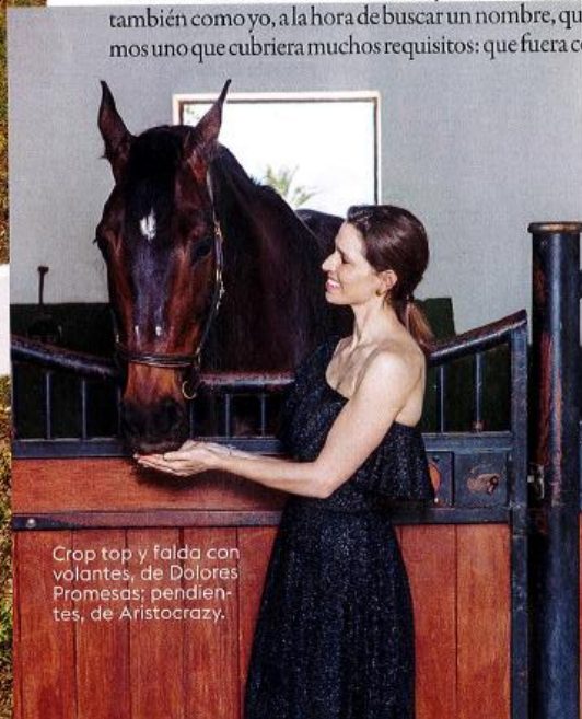
Crop top y falda con volantes, de Dolores Promesas; pendientes, de Aristocrazy.

NATALIA: No, me da la sensación que a veces te infravaloran