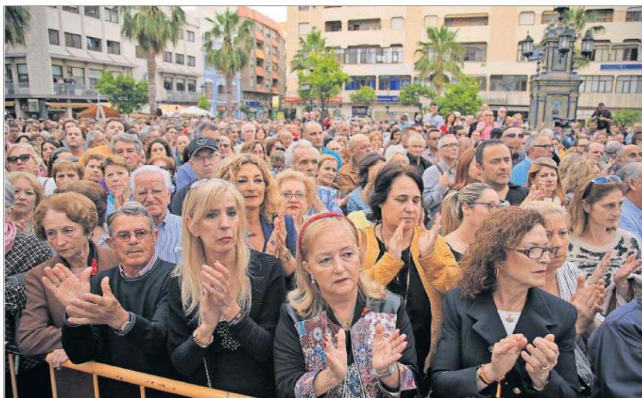
ALGECIRAS PLANTA CARA AL NARCOTRÁFICO. Miles de personas se concentraron ayer en el centro de Algeciras (Cádiz) para reclamar más seguridad ante la creciente ola de violencia vinculada al tráfico de drogas que sacude la zona. PÁGINA 24